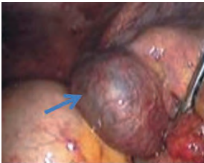
Figura 2. Imagen tomada por laparoscopia en la que se observa trompa derecha con embarazo ectópico (señalizado con la flecha).

Con independencia de cuál sea el mecanismo de producción, lo relevante es que todos los ginecobstetras y el resto del personal médico que presta atención a mujeres en edad fértil, tengan en cuenta la posibilidad de un embarazo ectópico después de una esterilización quirúrgica.