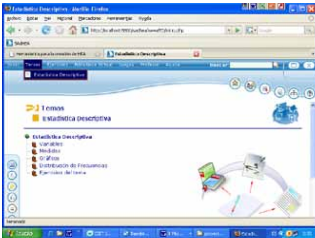
Figura 1. Índice del tema Estadística Descriptiva

Se logró crear un hiperentorno de aprendizaje con la cantidad de tutoriales y medias necesarias para facilitar el estudio del tema Estadística Descriptiva de la disciplina Informática Médica. Por otra parte se creó un entrenador como forma de evaluación del autoestudio con el hiperentorno.